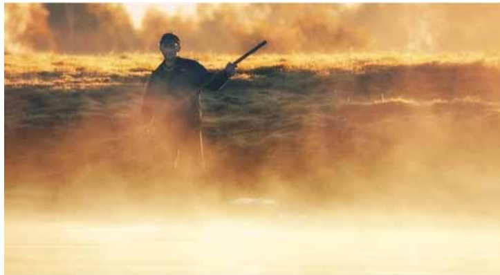
II Nagroda - ogień

Agnieszka Tichoniuk