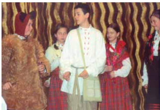
Żewżyki - „Hohotucha” ZS Bielsk Podlaski

25 listopada w Białymstoku odbyły się XVIII Prezentacje białoruskich zespołów obrzędowych. Uczestniczyło w nich sześć amatorskich grup teatralnych m.in. z Bielska Podlaskiego oraz Kuraszewa i Zbucza w gminie Czyże.