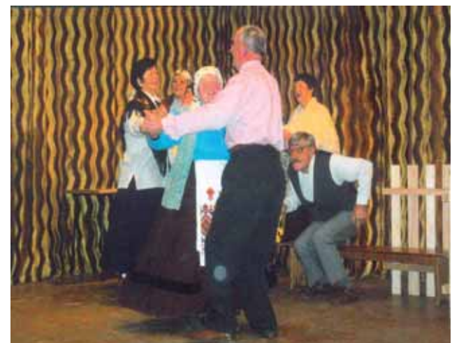
Wasiloczki z Bielska Podlaskiego - „Zwiastowanie”