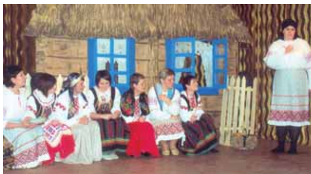
„Na wiejskiej ławeczce” - Ryboły

25 listopada w Białymstoku odbyły się XVIII Prezentacje białoruskich zespołów obrzędowych. Uczestniczyło w nich sześć amatorskich grup teatralnych m.in. z Bielska Podlaskiego oraz Kuraszewa i Zbucza w gminie Czyże.