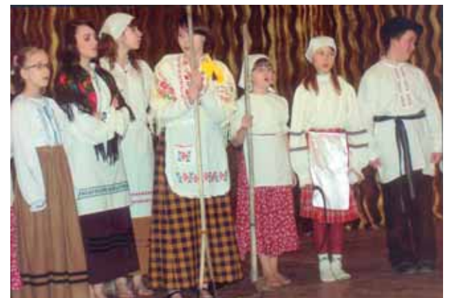
Antrakt BDK - „Sianokosy”